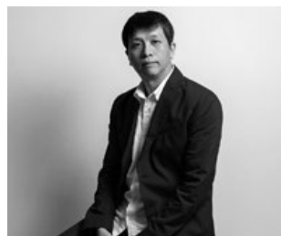
拾葉建築 + 室內設計 / 葉佳隴

1. 整體色調有規律地由濃轉淡，從入口處的深色系至客廳的灰白色調，使人的心境更為平靜沉穩。2. 高樓層基地十分明亮，在自然採光的照射下，更顯居家空間的優雅氛圍。