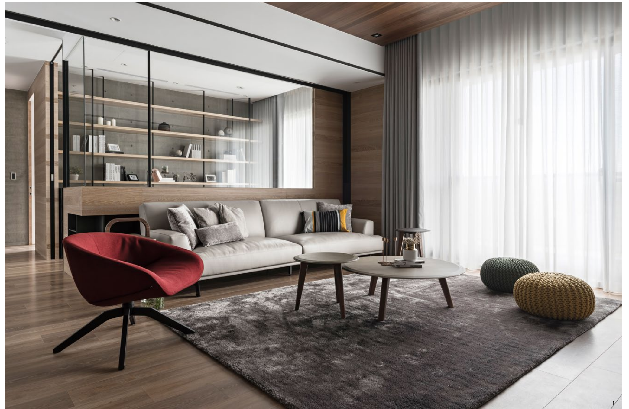
1. 溫潤木質搭配上暖色調的家具軟件，整體氛圍沉靜平和。

在整體空間色調的定奪上，業主希望以沉穩中帶著溫暖的感覺呈現，設計團隊遂在天花貼上穩重的深色調木皮，而牆面部分則以相對活潑的淺色木皮，搭配清水模、鐵件及石材，產生異材質間的碰撞，未有多餘的裝修，讓空間布滿沉靜氛圍，進而讓家更有溫度。設計師特別提到，電視牆選用清水模的原因在於，清水模擁有安定、內斂空間的能力，就如同空間的基底，能突顯每個材質的本質，也能有效平衡彼此的關係，不過清水模的使用比例、面積等細節尺度需格外注意，避免造成反效果，讓空間過於冷調。而葉佳隴在挑選軟件時，除了考量實用性以及與搭配契合度外，更期望帶來具張力的感度，單品類家具以暖色調為主軸，大塊實木餐桌彰顯大器與品味；本案的燈光依照空間需求進行規劃，客廳以不過亮的舒適暖光為主，在微量光線的投射下，每段相聚時光更顯彌足珍貴。採訪」陳映璇