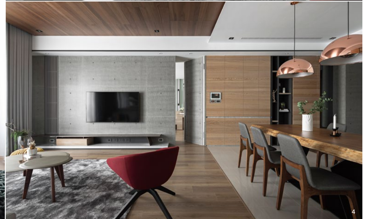
2. 業主熱衷於閱讀，因此住家中需有獨立書房的設置。葉佳隴以玻璃隔屏形塑書房空間，旨在保持室內良好的穿透性。3. 清水模電視牆為空間注入一股質樸氣息，也讓室內各式建材更為協調。4. 設計師利用材質的差異與櫃面線條區劃空間分界，例如客廳磁磚與木地板的交接、油漆天花與木皮天花的串聯，無形區分出場域。5. 三面採光的基地開闊明亮，高樓層建築更可引景入內。