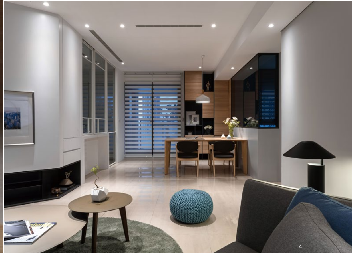
2. 圓弧型沙發與小塊毯的陳設，形成空間圍塑性，並在無形之中成為公共區域的軸心。3. 設計師利用轉角牆面串聯空間，並以此隱蔽原先格局的不妥之處。4. 通往後陽台的門裝設遮光簾，藉此引進戶外光線。5. 客廳後方大開窗靠近車水馬龍的市區，吵雜聲較易傳進室內，使用紗簾、布簾達到吸音、遮光的效果。